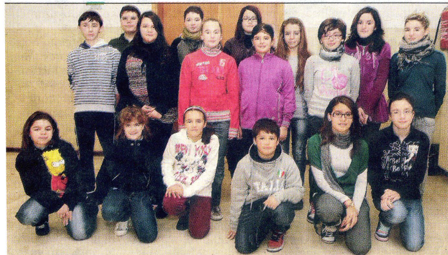
La redazione del giornalino on line e, a fianco, due immagini dell'incontro

ca locale del Polesine. Con la media di Rosolina sono otto le scuole che hanno già incontrato il direttore della "Voce" su un totale di 19 che hanno aderito al progetto.