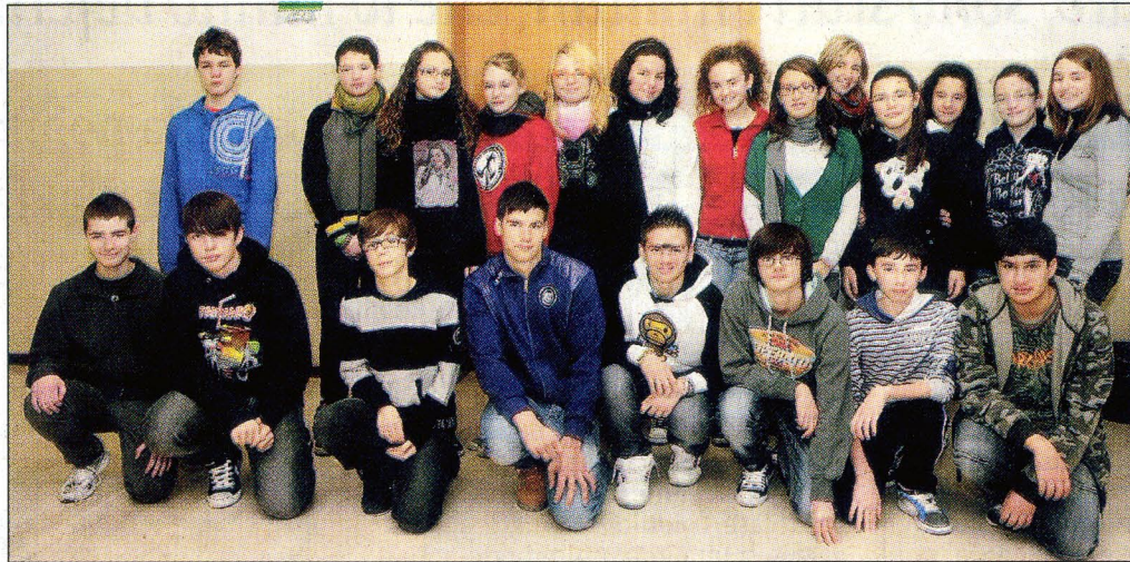
La IIB della scuola media di Rosolina Marin Sanudo il giovane

Seguito con la massima attenzione da ragazze e ragazzi, il direttore ha